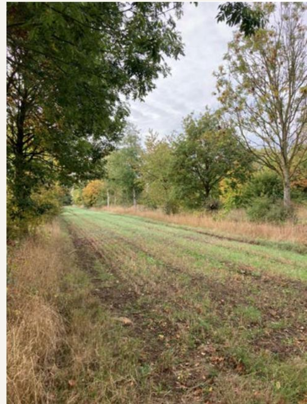
Heterogent skovlandbrugssystem fra Wakelyns med planteavl kombineret med skov-, frugt- og nøddearter.